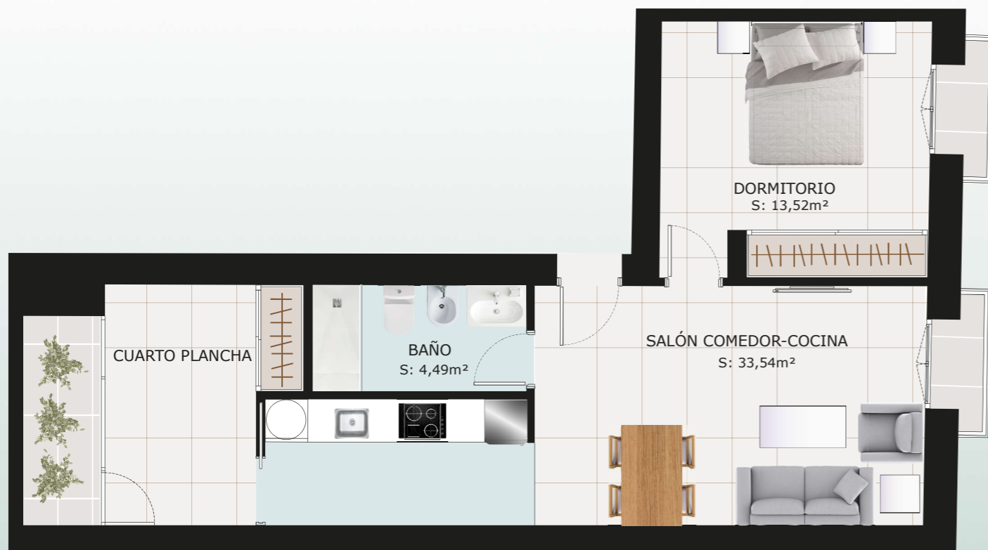
PLANTA PRIMERA escala: 1.75