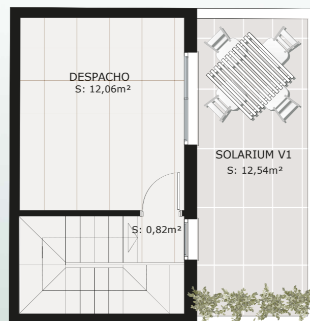
PLANTA ÁTICO escala: 1.75